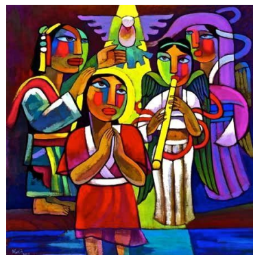
He Qi is een hedendaags Chinees kunstenaar die in Amerika verblijft.